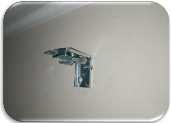
6. Смонтируйте кронштейны крепёжными элементами