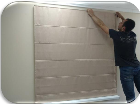
3. Расправьте штору и приложите к месту крепления