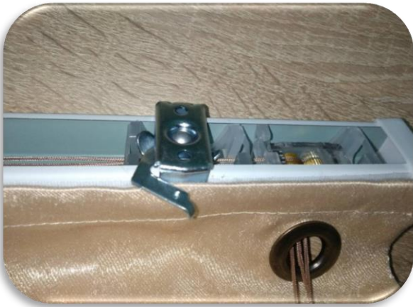
1 Вставьте кронштейны в карниз