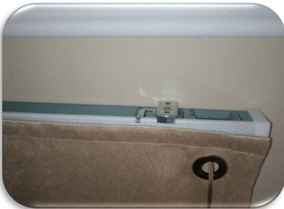
7. Вставьте карниз в кронштейны и защёлкните рычажки кронштейнов