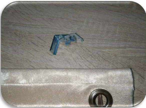
5. Снимите кронштейны с карниза