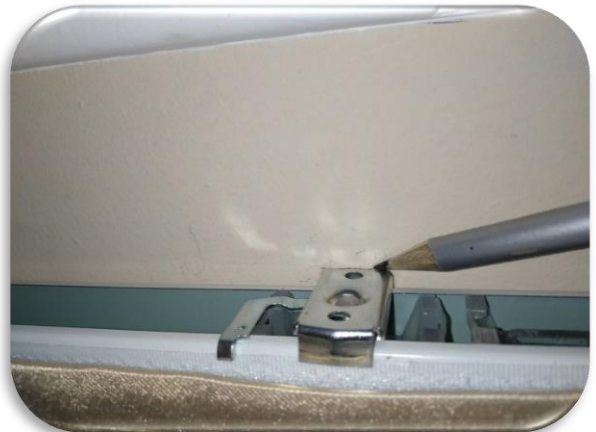
4. Карандашом отметьте место расположение кронштейнов