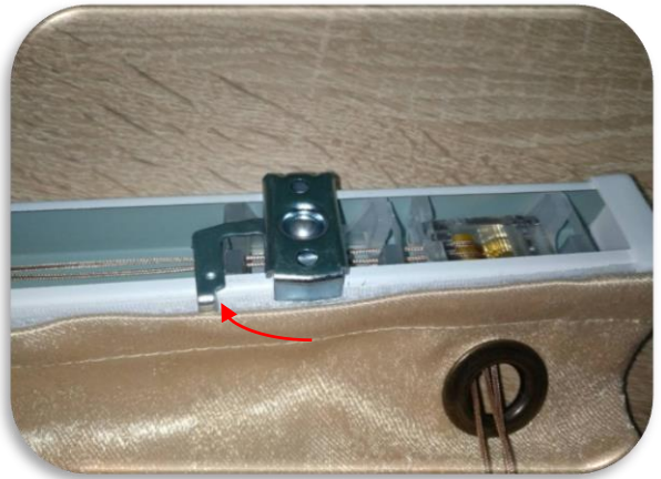
2. Зафиксируйте кронштейны- защёлкните рычажок кронштейна